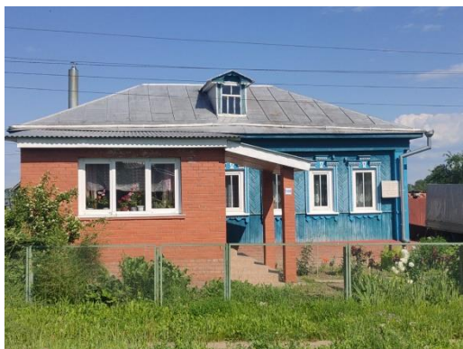
Дом И.П. Назарова