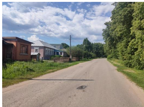
Деревня Новое Батурино