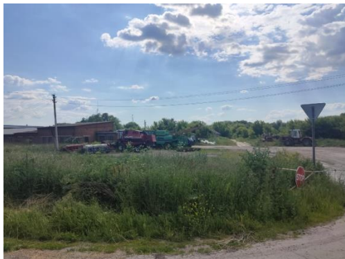
гараж СПК Колхоза «Батурино» (когда-то колхоза «Россия»)