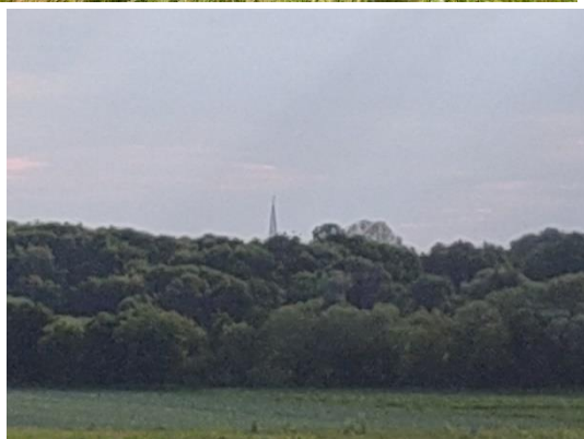
Вид на минарет