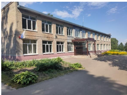
МБОУ «Батури́нская ОШ»