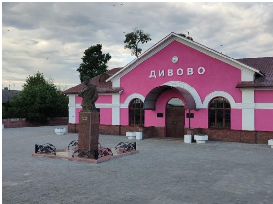
ж/д станция Дивово.