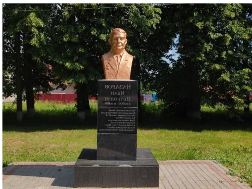
Памятник И.П. Назарову