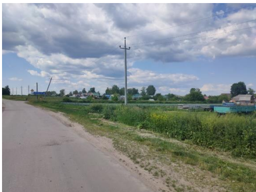
Деревня Старое Батурино