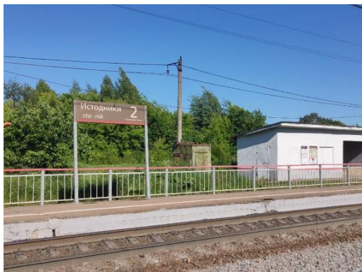
Ж/Д станция Источники